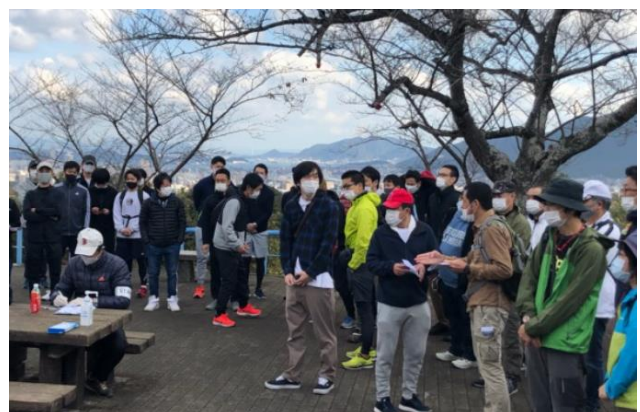
TOTOウォーキング(ウォーキングイベント)